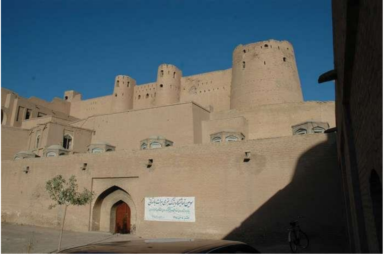
Herât: ancient citadel

A citadel built by Alexander the Great, Herât, Afghanistan