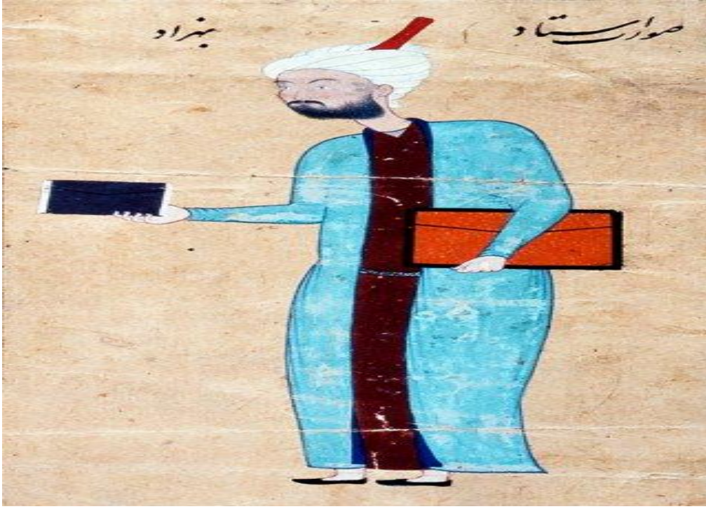
Bihzâd'ı yaşlılık yıllarında gösteren bir minyatür (İÜ Ktp., FY, nr. 1422, vr. 34 a ) 259

Bilindiği gibi Bihzâd, Herât'tan ayrıldıktan sonra hem Tebrîz hem de Bağdat okullarında eğitim gören öğrencilerin yapmış oldukları eserleri düzeltmekle ve kendi üslubunu onlara öğretmekle meşgul olmuştur. Daha önceki dönemlerde yetişen nakkaşlar, göz, kaş gibi unsurları çizerken Çin üslubunu benimseyip onu uygularken Bihzâd ile birlikte bu tarz değişmiştir. Hatta Bihzâd, kendine has üslubuyla minyatür ve nakışlara ayrı bir doğallık ve canlılık getirilmiştir. Böylece Bihzâd, minyatürü halkın yaşam tarzına yaklaştırılmış ve doğanın canlılığını nakışlarına aksettirmiştir. 260