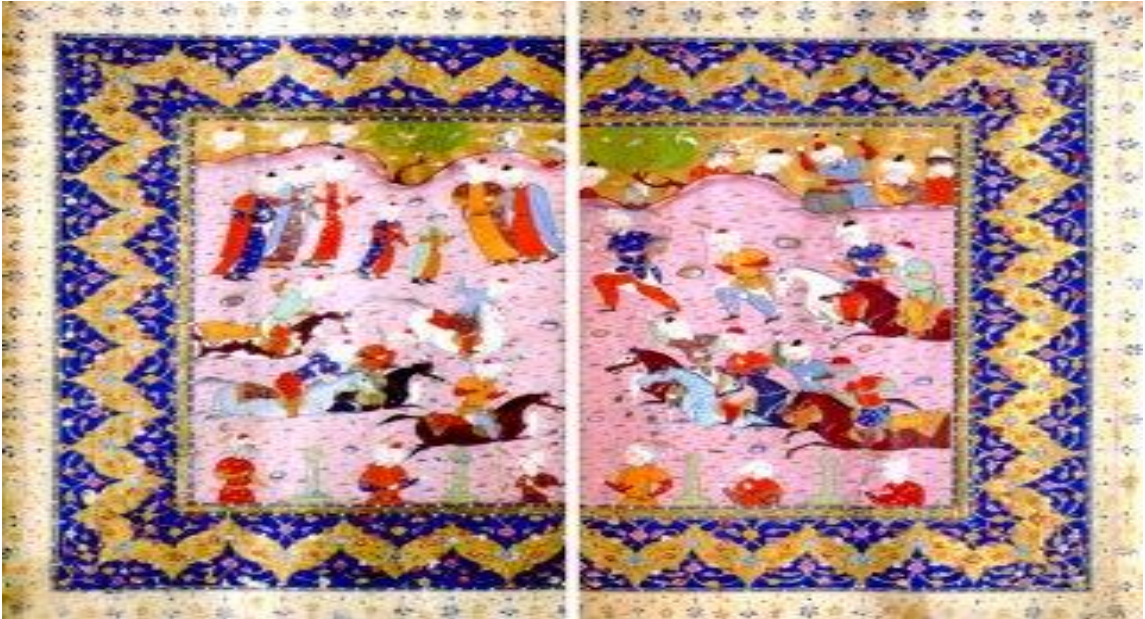
Abdurrahman-ı Câmî'nin Yûsuf u Züleyhâ adlı eserinden minyatürlü iki sayfa (İÜ Ktp, FY, nr. 1318, vr.

Timurlu hanedanının kültür tarihine önemli katkılarda bulunan Sultan Hüseyin-i Baykara, Alî Şîr Nevayî ve Molla Câmî arasındaki dostluk, arkadaşlık ve aralarında gelişen olaylar, hem bu dönem hem de Türk kültür tarihinde önemli bir yere sahiptir. Diğer dikkat çeken bir husus ise, Timurlu şehzadeler iktidarlarında yapılmış saraylar, hangâhlar, medreseler, çarşı ve pazarlar, kervansaraylar, türbe ve mezarlar, özellikle de yapılan mesire yerleri ve bağların bu ve daha sonraki dönem şairlerinin şiirlerine konu olmasıdır. Özellikle, Bâğ-ı Sefîd, Bâğ-ı Zağan ve Bâğ-ı Cihân-ârâ Molla Câmî'nin de şiirlerine konu olmuştur. 221