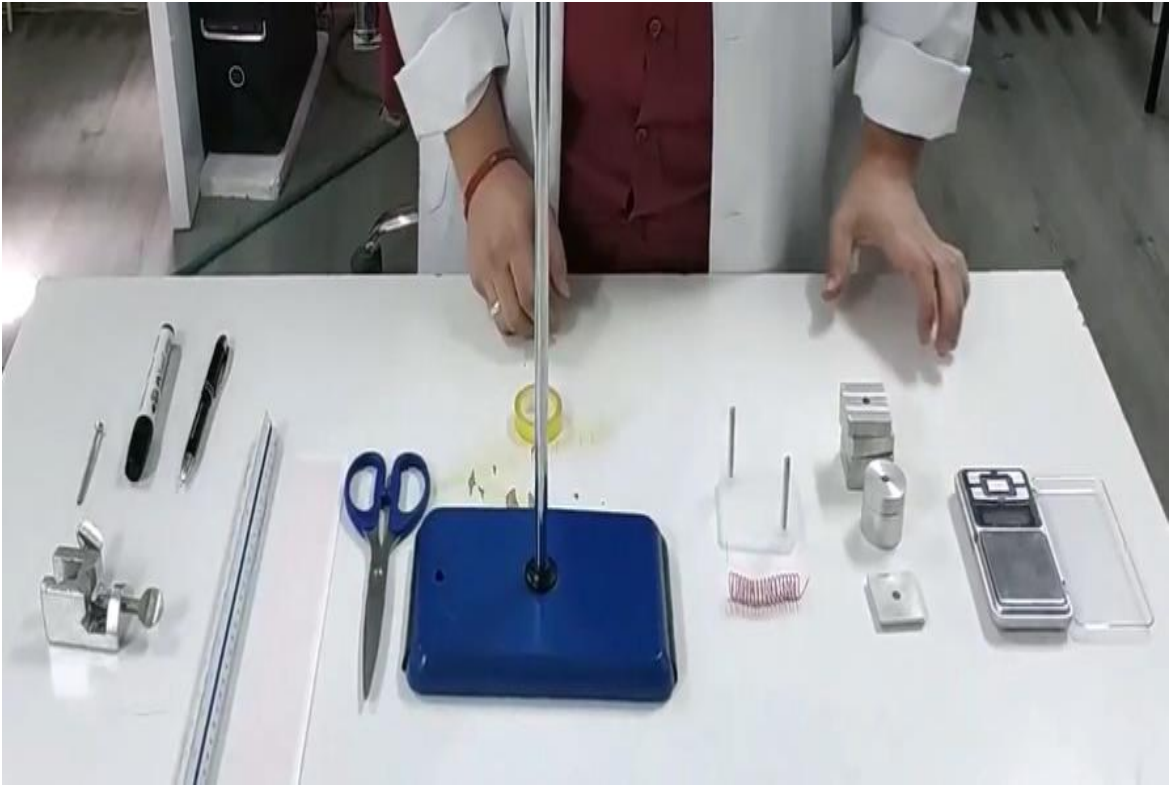
Şekil 3.1. Basit Dinamometre Yapılım Deneyi Malzemeleri