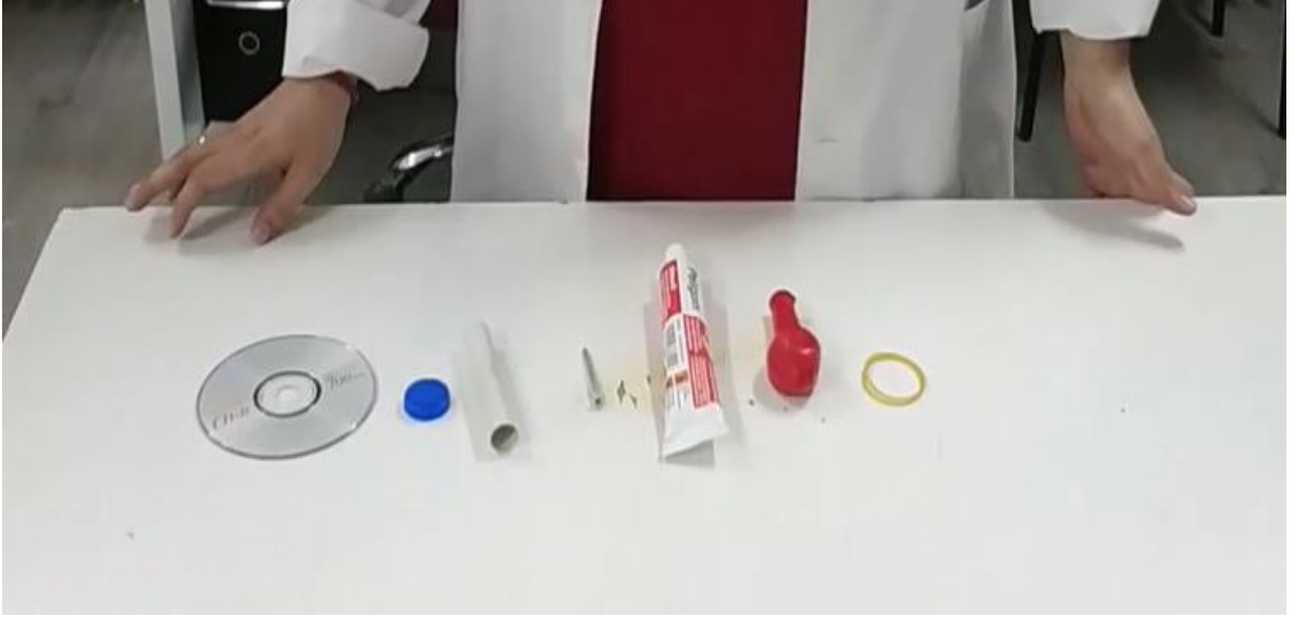
Şekil 3.2. Basit Hovercraft Deneyi Malzemeleri