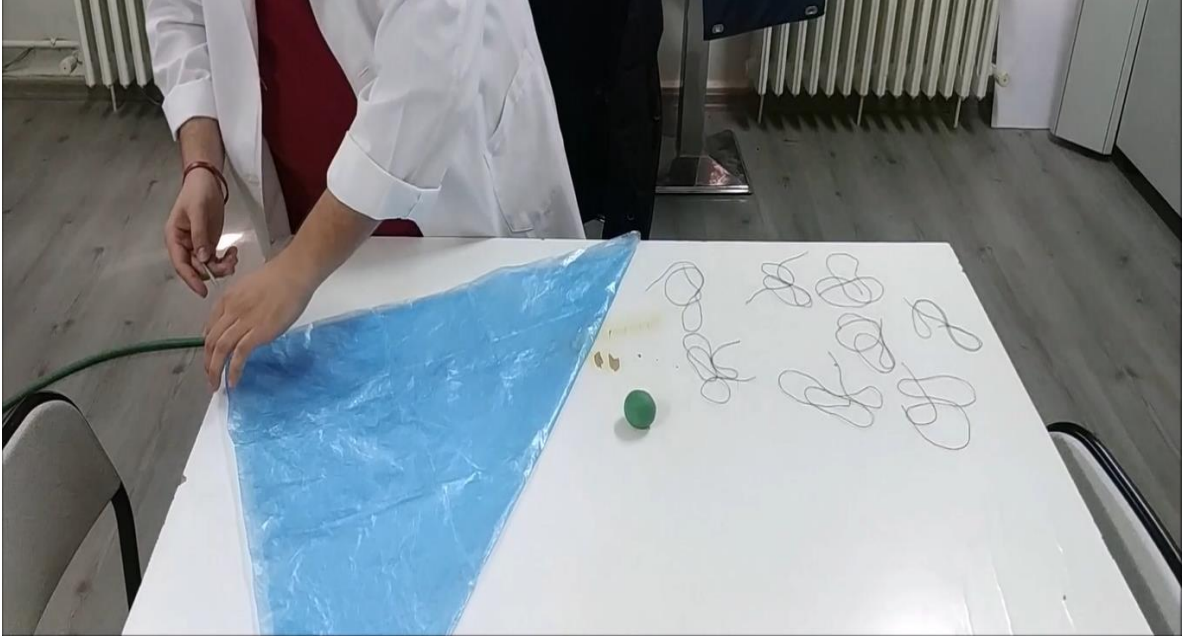
Şekil 3.3. Basit Paraşüt Yapalım Deneyi Malzemeleri