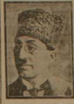
دو روز پیش از آنکه در تهران...