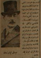
دو روز پیش از آنکه در تهران...