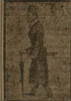
دو روز پیش از آنکه در تهران...