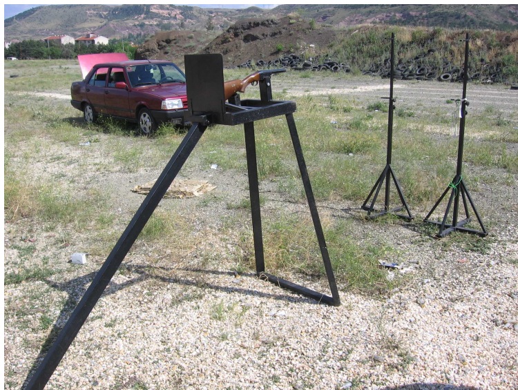
Şekil 3.3: Atış düzeneği

Seri atışlarda ve namlu kısaltılarak yapılacak atışlarda oluşacak geri tepmenin atış yapan kişiye zarar verebileceği endişesi ile tetiğin silah ele alınmadan çekilebileceği bir düzenek yaptırılmıştır. Av tüfeği, atışlar esnasında metal masa şeklindeki bu düzeneğe sabitlenmiştir (Şekil 3.3).