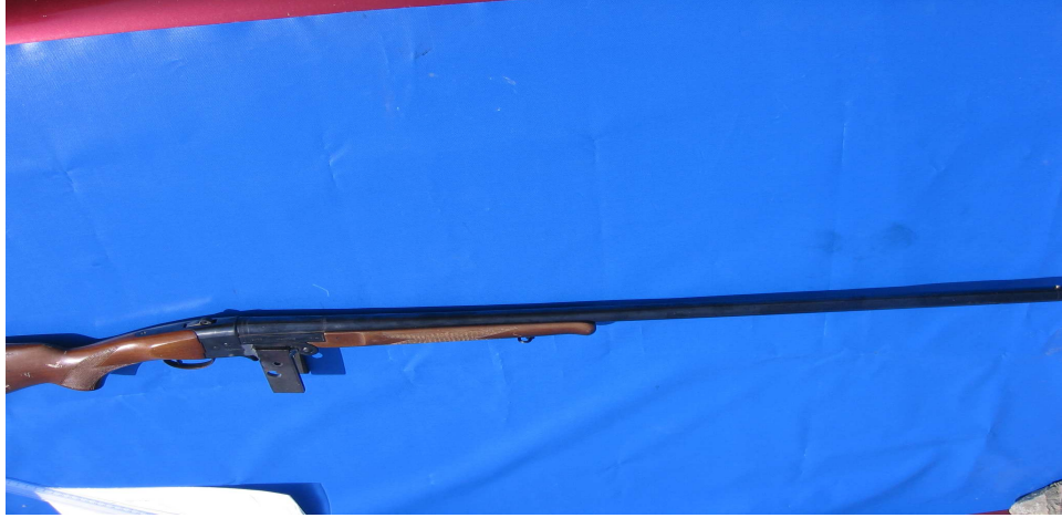
Şekil 3.1: Kullanılan Av Tüfeği

Yılmaz marka, tek kırma, 12 kalibre 8489 numaralı, 70 mm fişek yatağı uzunluğu olan, 70 cm namlu uzunluğunda, yivsiz ve şoksuz av tüfeği kullanılmıştır (Şekil 3.1).