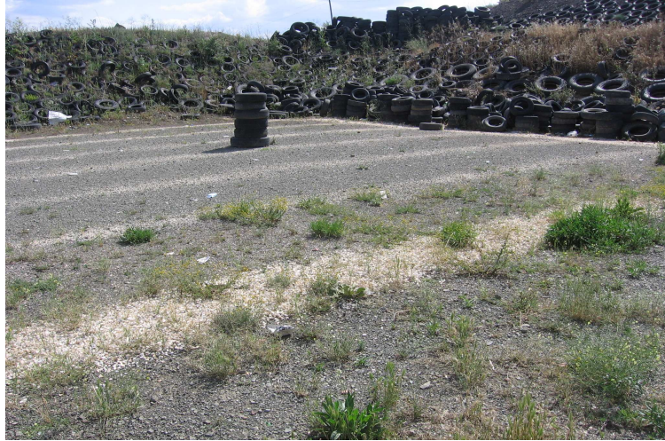
Şekil 3.2: Atış Poligonu