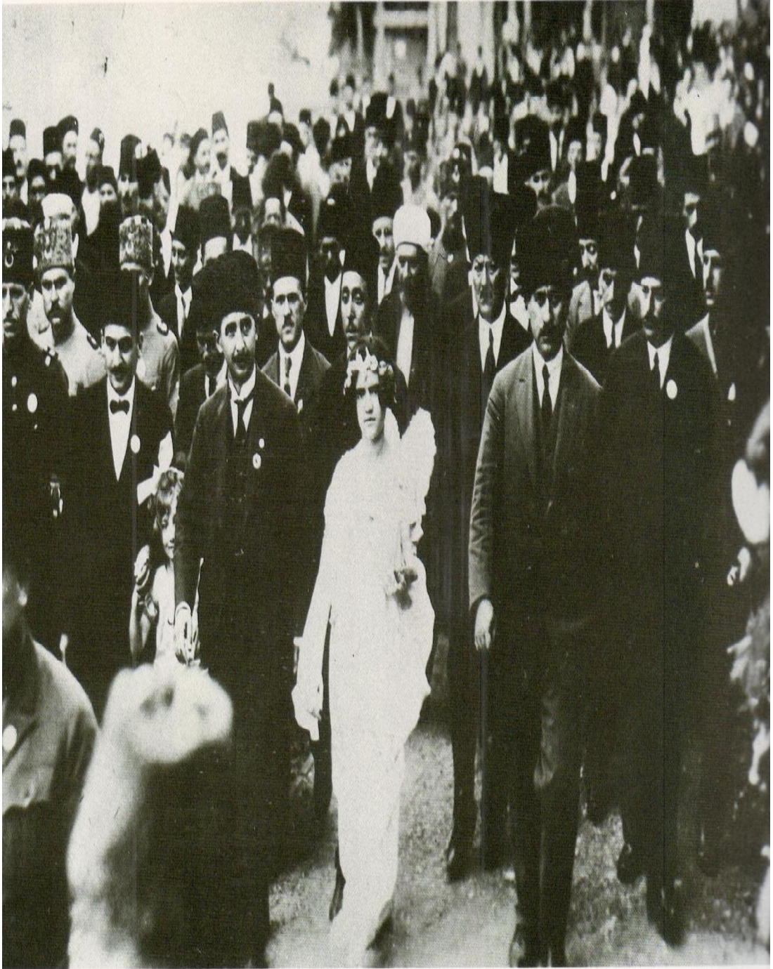
Ek 11: 10 Ağustos 1923. Lozan'dan dönen Türk Heyeti İstanbul'da törenlerle karşılanıyor. ( Lausanne on its 70th Anniversary, s.72. )