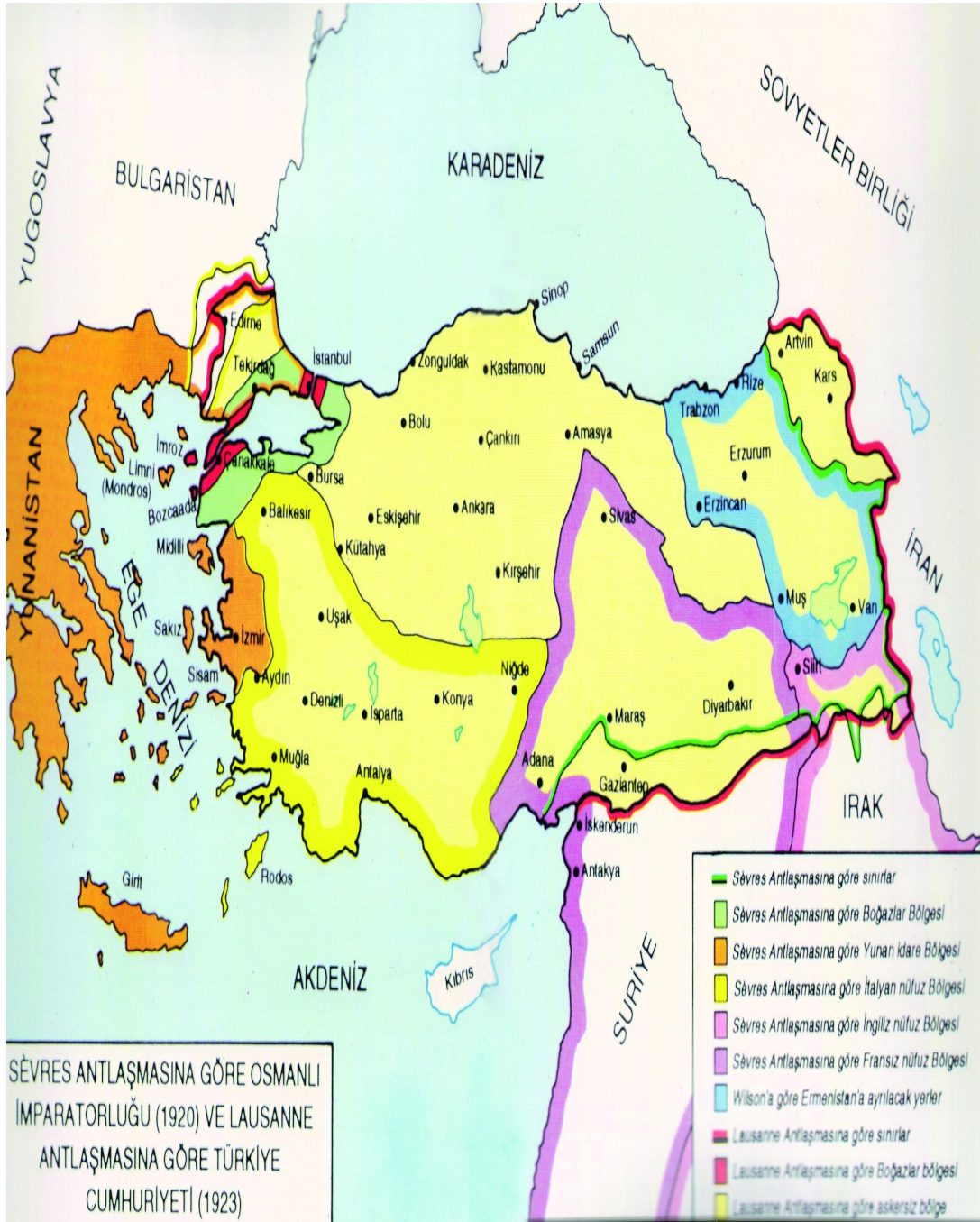
EK 13: Sevr Antlaşması'na göre Osmanlı İmparatorluğu ve Lozan Antlaşması'na göre Türkiye Cumhuriyeti ( Lausanne on its 70th Anniversary , s.44-45. )