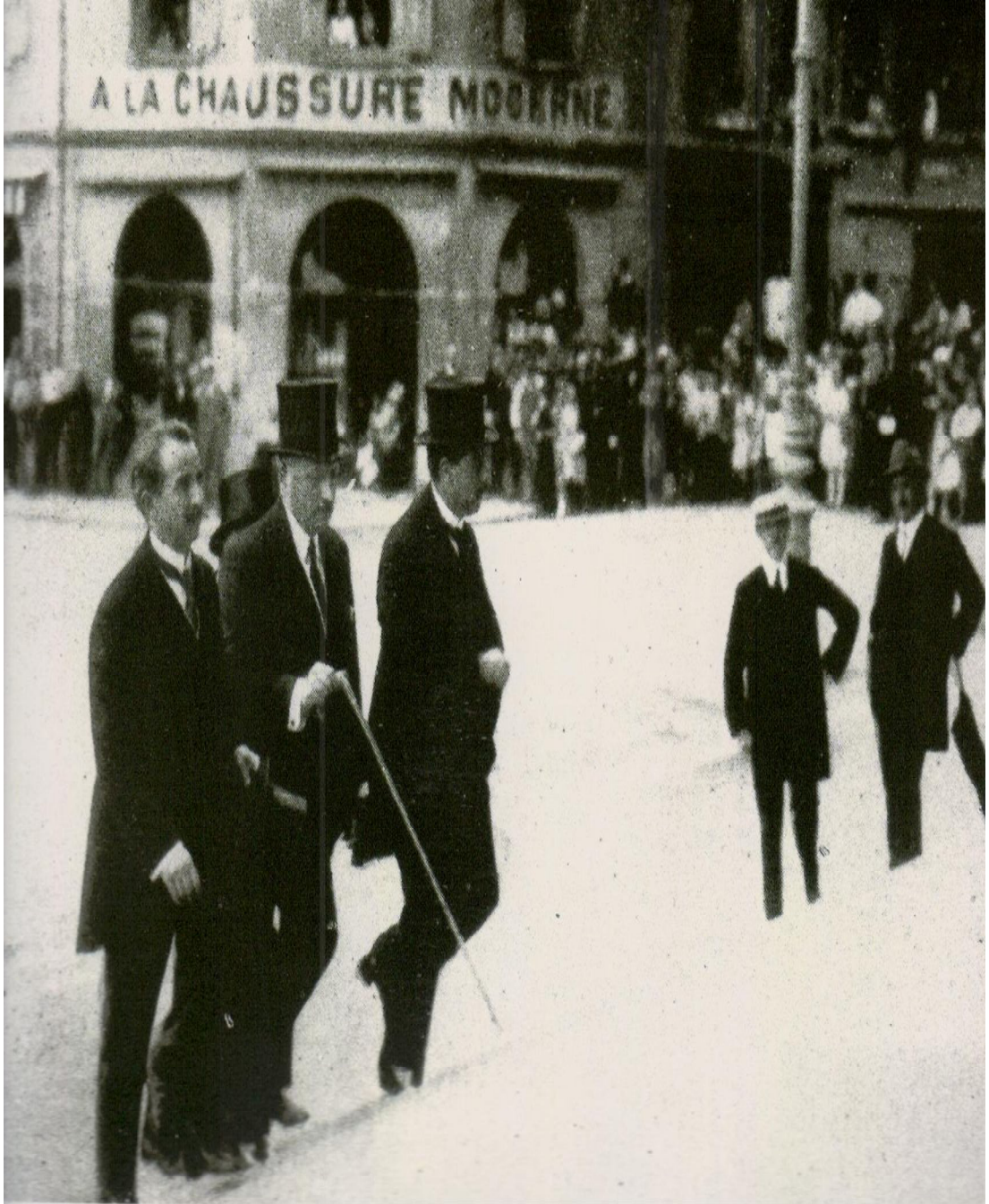
Ek 7: Türk Delegeleri Lozan Barış Antlaşması'nın imza törenine giderken çekilmiş bir fotoğraf. ( Lausanne on its 70th Anniversary ,s.53. )