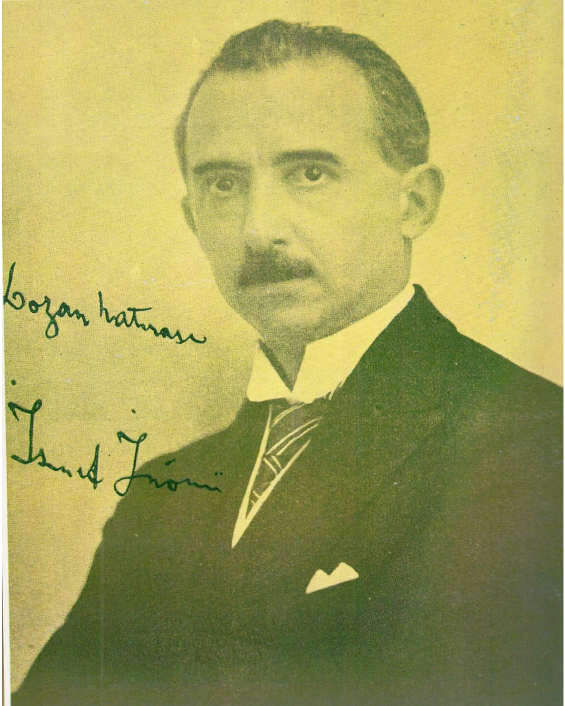
Ek 1: Hariciye Vekili ve Türk Temsilci Heyeti Başkanı İsmet Paşa'nın, Lozan Barış Antlaşması'nın imzalandığı gün Türk Temsilci Heyeti'ne dağıttığı kendi imzasını taşıyan fotoğraf. ( Lozan'ın 70. Yıldönümünde İsmet İnönü , s.48. )