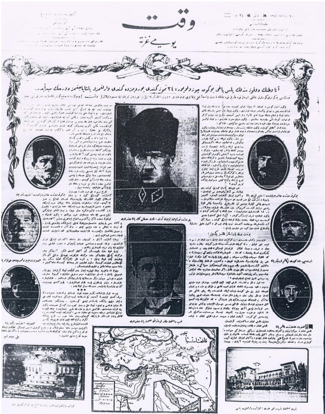
Ek 10: Vakit Gazetesi, Lozan Barış Antlaşması'nın imzalanmasını "Anavatannın dokuz senelik yas bağı bugün çözülüyor" ifadesiyle okuyucularına duyuruyor. (Vakit, 25 Temmuz 1923)