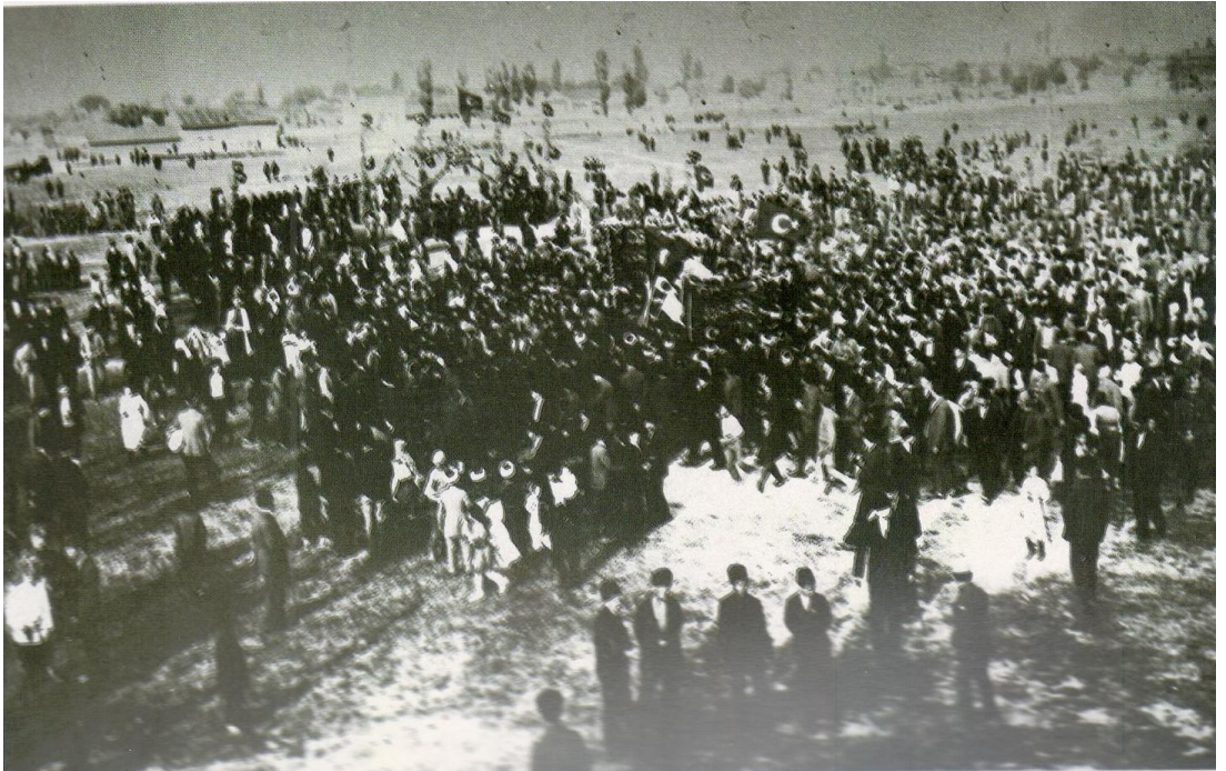
Ek 12: 25 Temmuz 1923. Lozan Barış Antlaşması'nın imzalanması sebebiyle Eskişehir'de yapılan kutlamalar. ( Lausanne on its 70th Anniversary , s.76. )