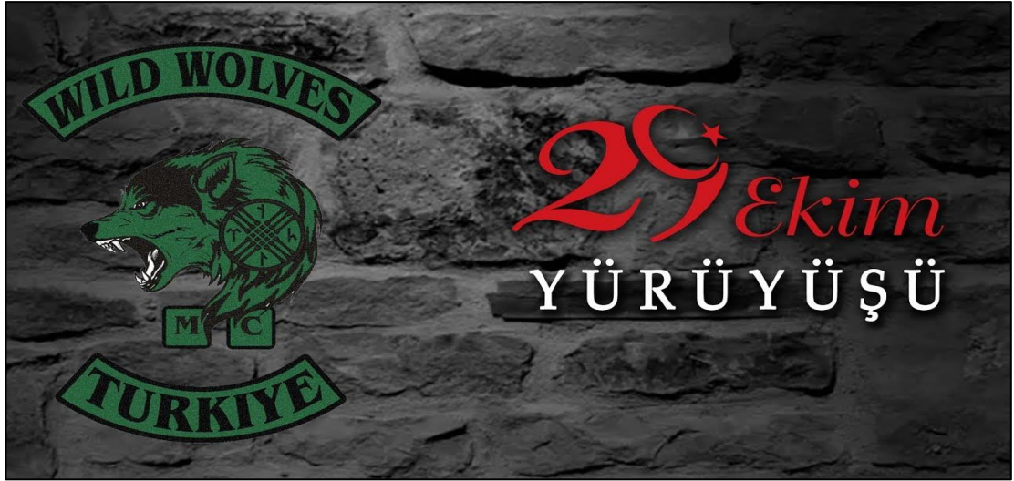
Şekil 3. Wild Wolves MC 29 Ekim yürüyüş flyerı