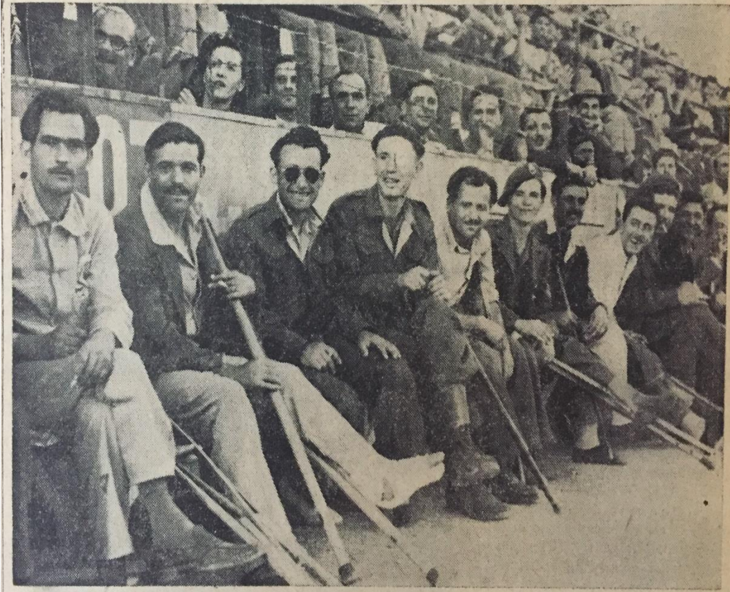
Yunan iç harbinde yaralanan askerler evvelki gün Atina'da yapılan Türkiye - Mısır milli futbol karşılaşmasını kendilerine ayrılan yerden seyrederek.

EK- 8: 15 Mayıs 1949 tarihli Hürriyet gazetesi.