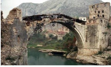
Şekil 6: Bosna Hersek İç Savaşında Mostar Köprüsü

gibi ülkelerin bağışlarıyla yürütülmüş ve proje için Türkiye 1 milyon dolar bağış yapmıştır 41 .