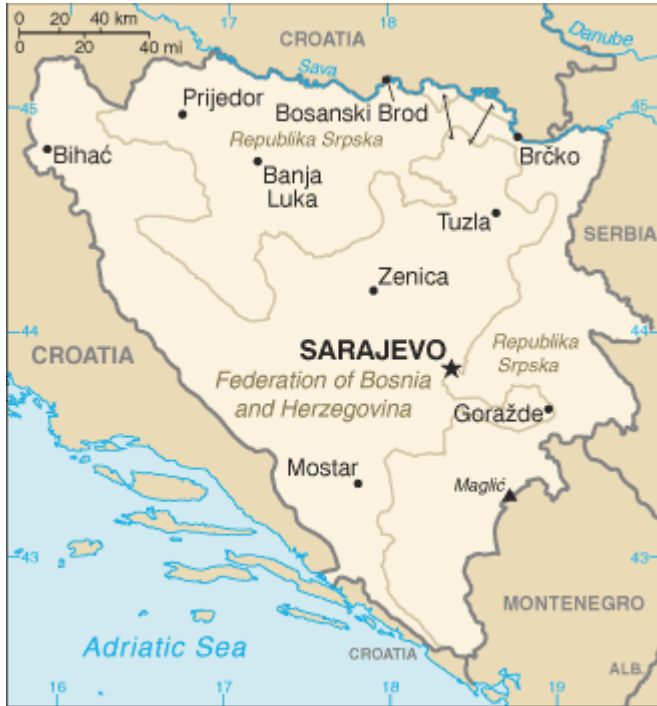
Şekil 5: Bosna Savaşı sonrası sınırların dağılımı (2002)

ateşkes niteliğinde olmuştur ve Hırvatlar ile Müslümanlar arasındaki çatışmaların durulması için çok önemli bir rol oynamıştır. Ayrıca ABD'nin Bosna'daki olaylara daha fazla katkı sağlayacağını göstergesi olmuştur. Bu sırada ABD'de silah ambargosunun kaldırılması için iç siyasette tartışmalar başlamıştır. Fakat Fransa ve İngiltere ambargonun kaldırılmasının savaşa faydası olmayacağını düşünmüştür. Aynı zamanda Kuzey Atlantik Antlaşması Örgütü (North Atlantic Treaty Organization-NATO) daha geniş kapsamlı ve etkili müdahale için harekete geçmiştir. Bosna Hersek'teki Sırp güçlerini hedef alan hava bombardımanı sonrasında Sırp güçleri önce ateşkes yapmak ve sonrasında ise bugün Dayton Barış Anlaşması (Dayton Peace Agreement-DPA) olarak bildiğimiz bir barış anlaşması imzalamak zorunda kalmışlardır. Bu antlaşma 14 Aralık 1995'te Bosna Hersek'in Cumhurbaşkanı İzzetbegoviç, Hırvatistan Devlet Başkanı Franjo Tudjman ve Sırbistan Devlet Başkanı Slobodan Miloseviç arasında ABD'nin Ohio eyaletinde imzalanmıştır.