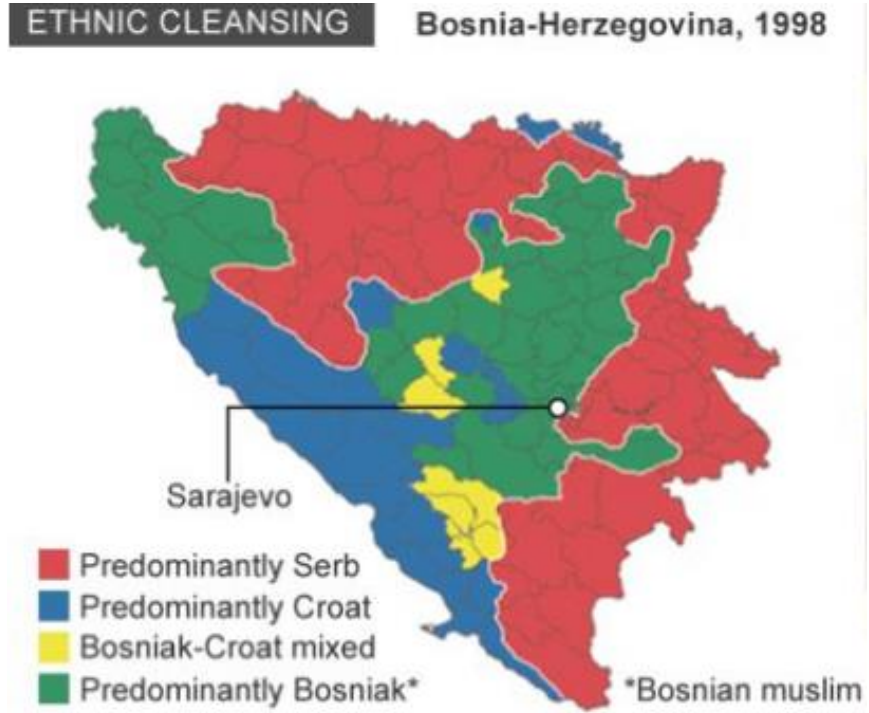
Şekil 2: İç Savaşın Sonra Bosna Hersek'teki Boşnak, Sırp ve Hırvatların dağılımı (1998)