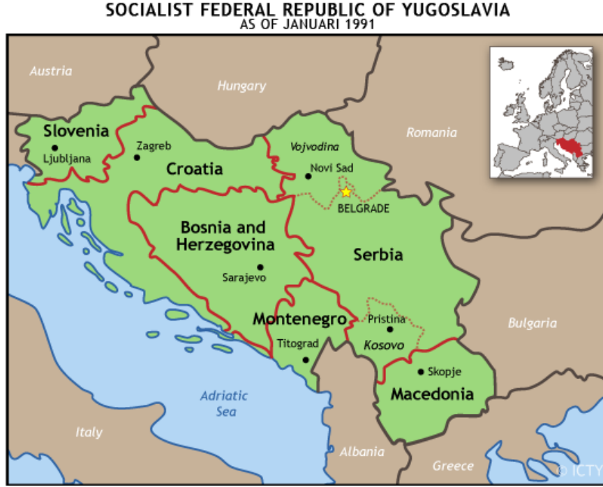
Şekil 3: Eski Yugoslavya sınırları (1991)