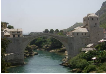
Şekil 7: Yeniden Yapılandırma Çalışmaları Bittikten Sonra Mostar Köprüsü