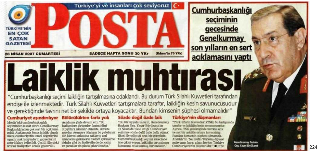
RESİM 19: LAİKLİĞE TEHDİT OLARAK ABDULLAH GÜL

Gül’ün cumhurbaşkanı seçilmesi sonrasında var olan korkuların gerçekleşip gerçekleşmeyeceği konusunun merakı hemen seçim sonrasındaki gazete başlıklarında görmek mümkündür. Abdullah Gül’ün mecliste yaptığı yemin, “İlk konuşma laiklik oldu” başlığıyla verilmiştir. Haberin içeriğinde Gül’ün Cumhurbaşkanı olarak yaptığı ilk konuşmada “laiklik ve demokrasi” vurgusu yaptığı ve kapısının herkese açık olduğunu söylediği belirtilmiştir. 225