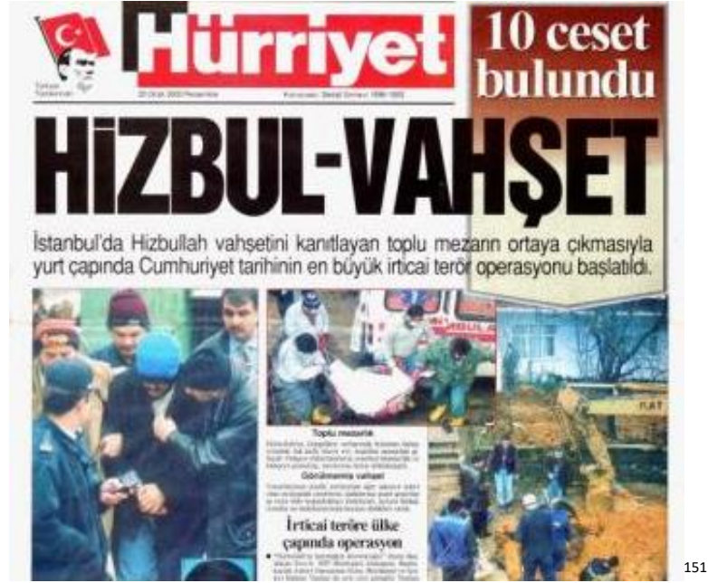
RESİM 10: HİZBUL-VAHŞET (HİZBULLAH VAHŞETİNİ ORTAYA ÇIKARAN TOPLU MEZARLAR)