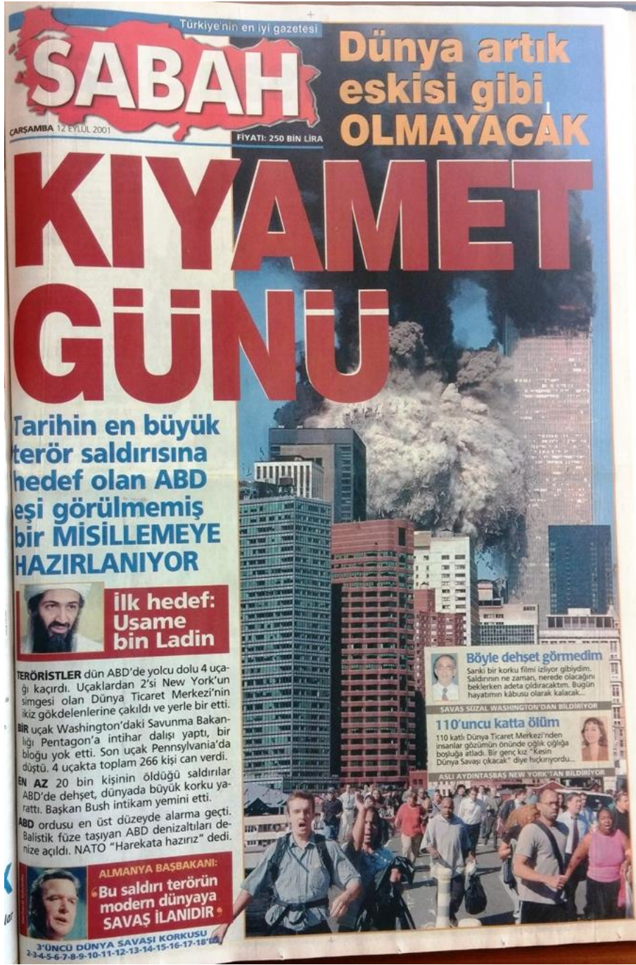
RESİM 14: KIYAMET GÜNÜ (11 EYLÜL)