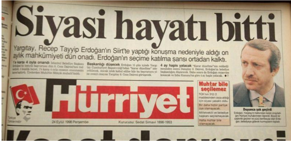
RESİM 21: MUHTAR BİLE OLAMAZ

sürekli dikkatleri üzerinde toplamış ve her hareketinin altında farklı İslamî imajlar aranılması gayretini beraberinde getirmiştir. Erdoğan'ın Milli Görüş geleneği içerisindeki bir partinin (RP) il başkanlığını yapmış olması ve bu partiden de İstanbul gibi önemli bir şehrin belediye başkanlığını kazanması medyanın ve tüm objektiflerin dikkatini üzerine çekmiştir. Erdoğan üzerinden İslamofobik birtakım tutumların ortaya çıkmasını siyaset dünyasına girdiği gençlik yıllarına kadar götürmek mümkündür. Ancak, Ziya Gökalp'e ait "Minareler süngü, kubbeler miğfer,/Camiler kışlamız, müminler asker,/Bu ilahi ordu dinimi bekler,/Allah-u Ekber Allah-u Ekber." dörtlüğüyle biten ve siyasi arenada bir başkaldırı olarak görülen şiiri okumasıyla bu durum zirveye çıkmıştır. Çünkü okuduğu bu şiir Erdoğan'ı İstanbul Büyükşehir Belediye Başkanlığından azlettirmekle kalmamış siyasi yasaklı ve medyanın tabiriyle "Muhtar bile olmayacak" bir duruma getirmiştir. 227