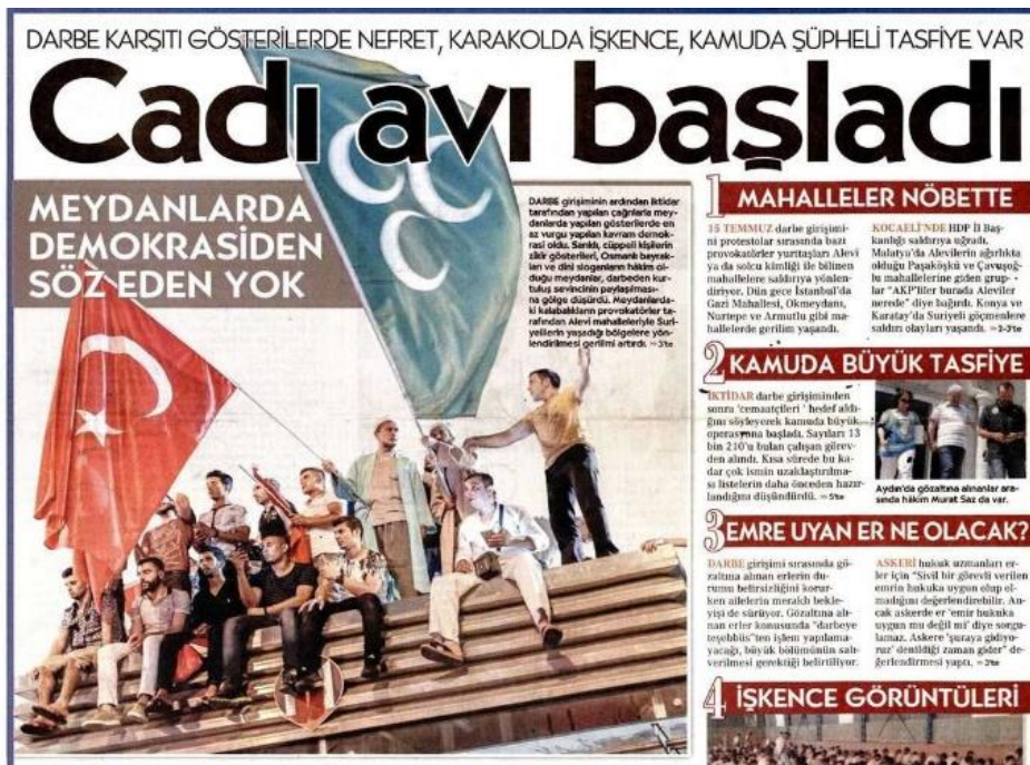
RESİM 24: 3 HİLAL VE TÜRK BAYRAĞI

“Fethullahçılar” olarak bilinen grubun teşebbüsüyle yaşanan 15 Temmuz Darbe girişimi, bazı medya gruplarınca İslamcılar tarafından yapılan bir darbe gibi lanse edilmeye çalışılmıştır. Bu başarısız darbe girişiminin sonrasında hedefin Fethullah Gülen ve takipçileri