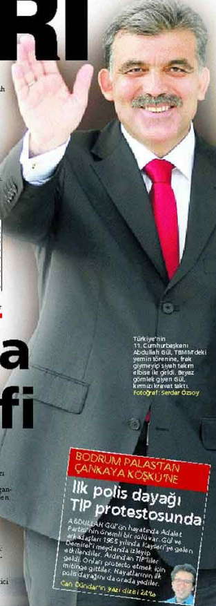
Türkiye'nin 11. Cumhurbaşkanı Abdullah Gül, TBMM'deki yemin törenine, Irak çarşaması ve siyah takım elbise ile geldi. Başbakan Gül'ün yanında, kemal kravatı vardı.