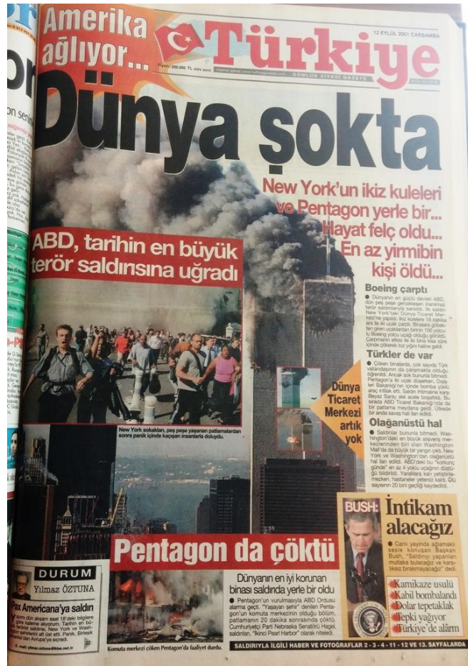
RESİM 15: DÜNYA ŞOKTA (11 EYLÜL)

Filistin halkının bu tutumu, Milliyet gazetesinin haberinde “Filistin Halkı Saldırını Kutladı” başlığıyla yer aldı. Filistin halkının sokaklarda sevinç gösterileri yaptığı ve havaya makineli tüfeklerle ateş açtıkları haberin içeriğinde yer alan konular arasındaydı. Saldırıyla alakalı açıklama yapan “İslamî Cihat Örgütü”, bu saldırının nedeninin Amerika’nın Ortadoğu’daki yanlış politikaları olduğunu ifade ederek saldırıyı kınadığını belirtti 167 Milliyet gazetesinin bu olaydan 3 gün sonrasındaki yayınının ilk sayfasında saldırıyı düzenleyenlerle ilgili olarak: “Hepsi İslam Ülkesinden” başlığı da yine Müslümanlar için üzüntüyü beraberinde getirdi. 168