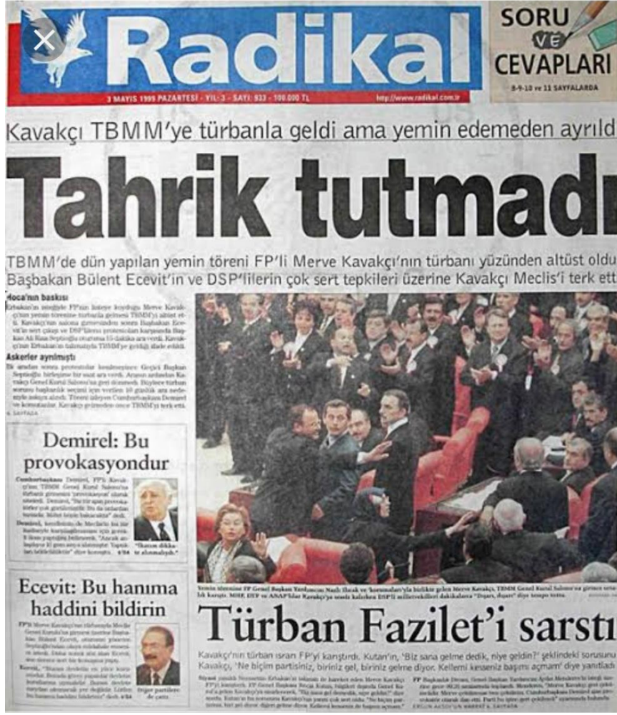
RESİM 9: TAHRİK TUTMADI (MERVE KAVAKÇI KRİZİ)