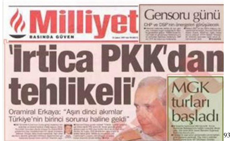
RESİM 4: İRTİCA PKK’DEN DAHA TEHLİKELİ

Bu arařtırmada sorulan, “Sizce bugün Türkiye için en ciddi tehlike nedir?” sorusuna ankete katılanların %12,6’sı “irtica” cevabını vermiřtir. Ayrıntılara bakıldıđında “ırkçılık tehlikesi”nin birinci sırada yer aldıđı Diyarbakır haricinde, tüm illerde “demokrasinin kesintiye uğraması en büyük tehlike” olarak görölmüřtür. İzmir’de “irtica”, İstanbul’da “ırkçılık”, diđer illerde ise “komünizm” ikinci büyük tehlike olarak görölmektedir. Arařtırmada bir başka dikkat çeken nokta ise “irtica” veya “dini geliřmeler”i tehlikeli olarak iřaretleyenlerin milletvekili aday özelliđi olarak, “sosyal demokratlıđı” ve “laikliđi” tercih etmesidir. 92 İrticayı bir tehdit olarak görenlerin oranının % 12,6 olması aynı zamanda Türkiye’de irticayı tehdit olarak görmeyenlerin oranının da %87,4 olduđunu gösteriyor. Yani halkın da orduyla aynı düşünmediđi görölmektedir