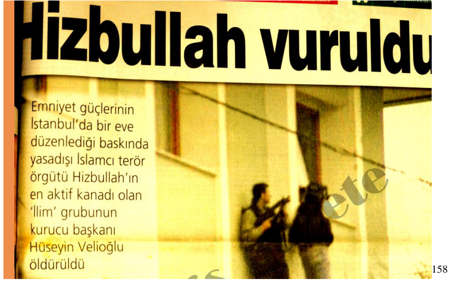
RESİM 13: HİZBULLAH VURULDU

Yukarıda örnek olarak verilen gazete haberlerinde İslamofobinin nasıl yaygınlaştırıldığı görülmektedir. İslam, uzun yıllardan beri terör ile birlikte hiç çekinilmeden kullanılmıştır. Türkiye Cumhurbaşkanı Recep Tayyip Erdoğan'ın da bu konuyla alakalı olarak birçok kez şu şekilde açıklama yaptığı bilinmektedir: