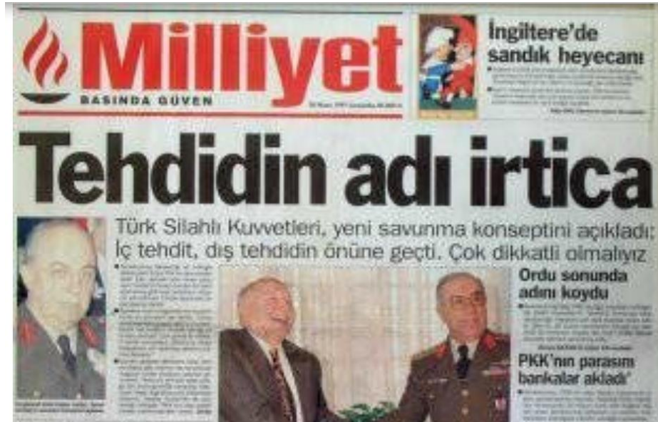
RESİM 3: TEHDİDİN ADI İRTİCA

gelişinin Ocak ayının ortasına rastladığını ve o tarihten itibaren de hep gündemin tepesinde yer aldığını söylemiştir. Ocak ortasında olmasının nedenini ise askerlerin 17 Ocak'ta Genelkurmay'da, Cumhurbaşkanı'na verdikleri "irtica brifingi" ile açıklamıştır. Brifingin ardından Cumhurbaşkanı Demirel bazı çalışmalar yapmış ve 3 Şubat'ta Erbakan'a ilk irtica mektubunu yazmıştır. Üstelik bununla da yetinmeyerek 4 Şubat'ta bir tane daha yazmıştır. Demirel, 3 ve 4 Şubat arasında, yani iki gün içinde, Başbakan'a "laik Cumhuriyet'in geleceği, demokrasi, hukuk devleti, irtica tehlikesi" konusunda tam beş mektup göndermiştir. Bir de Cumhurbaşkanlığı Genel Sekreteri Necdet Seçkinöz'ün Adalet Bakanı ile İçişleri Bakanı'na gönderdiği mektuplar var. Mektupların konusu yine irtica uyarısı ve beş mektuptan ibarettir. Donat, hükûmete yazılan mektupların gizli evrakın bulunduğu kasalarda muhafaza edildiğini; fakat sözünü ettiği on mektubun gizlilik ötesi kasa dediği kozmik kasada olduğunu ifade etmiştir. 67