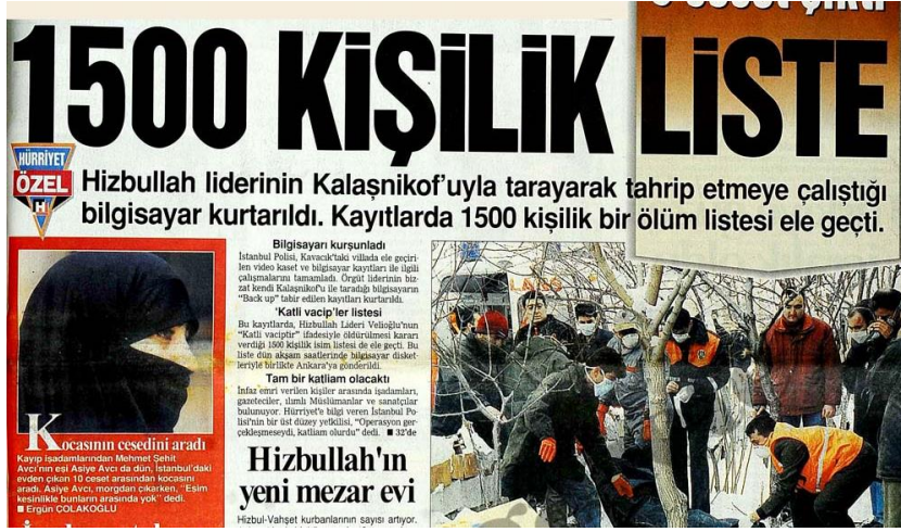
RESİM 11: HİZBULLAH'IN 1500 KİŞİLİK ÖLÜM LİSTESİ