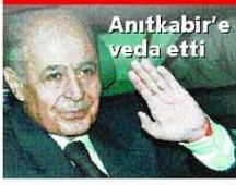
Anıtkabir'e veda etti