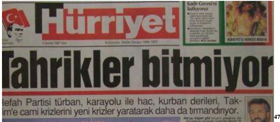
RESİM 1: REFAH PARTİSİ TÜRBAN, KARAYOLU İLE HAC, KURBAN DERİLERİ, TAKSİM’E CAMİ KRİZLERİ

RP’nin muhafazakâr bir siyaset anlayışına sahip olması nedeniyle çözüme kavuşturmak istediği; başörtüsü, karayoluyla hac gibi dinî hayat ile ilgili meseleler sürekli olarak güncelliğini korumuştur. RP’nin bu konulardaki tavrı medyada gerginlik çıkarmak olarak nitelenmiştir ve “Tahrikler bitmiyor” başlığıyla yer almıştır. Bu ithamlara karşı ise dönemin Devlet Bakanı Abdullah Gül (1950-...), siyasi ortamı RP’nin simgesel politikalarla gerdiği eleştirilerinin haksızlık olduğunu belirtmiştir. Buna ilaveten kendilerinin başörtüsü, karayoluyla hac gibi konularda uzlaşma arayarak çalıştıklarını ifade etmiştir. 46