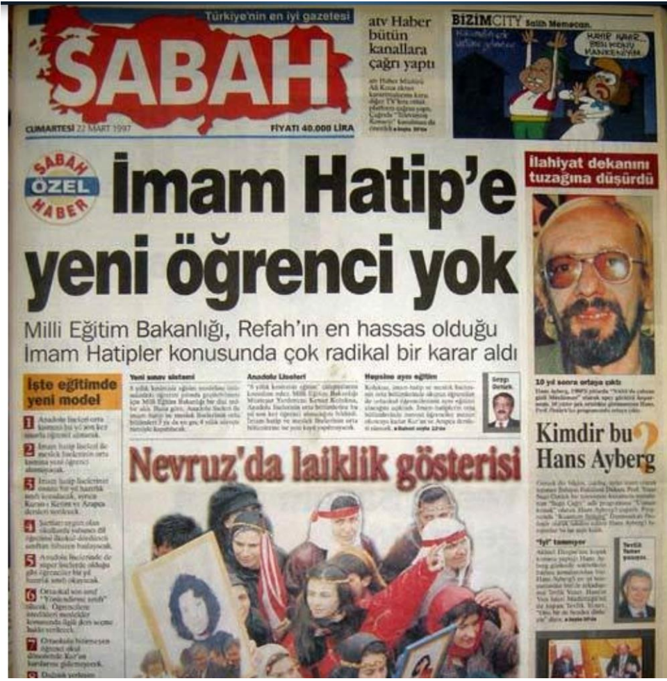
RESİM 5: İMAM HATİPE YENİ ÖĞRENCİ YOK