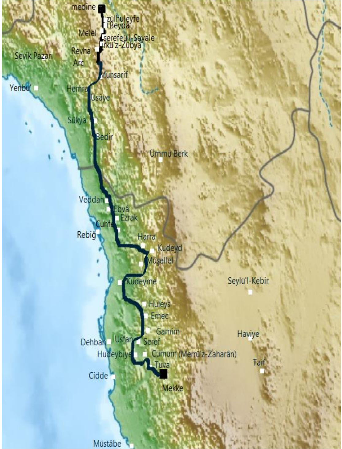
Harita-3. Hz. Muhammed (sav)'in Veda Hac'ında İzlediği Güzergâh.