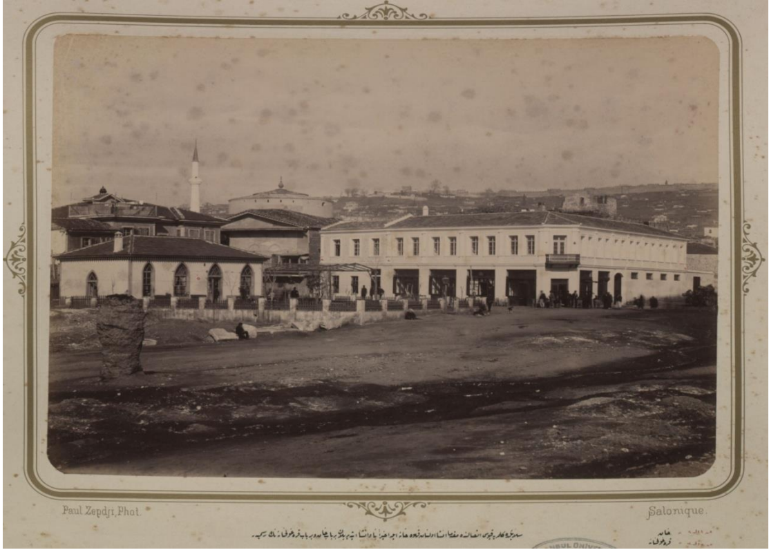
Ek 4: Selanik'te Kelemerye Kapısı Dışında İnşa Ettirilen Evler