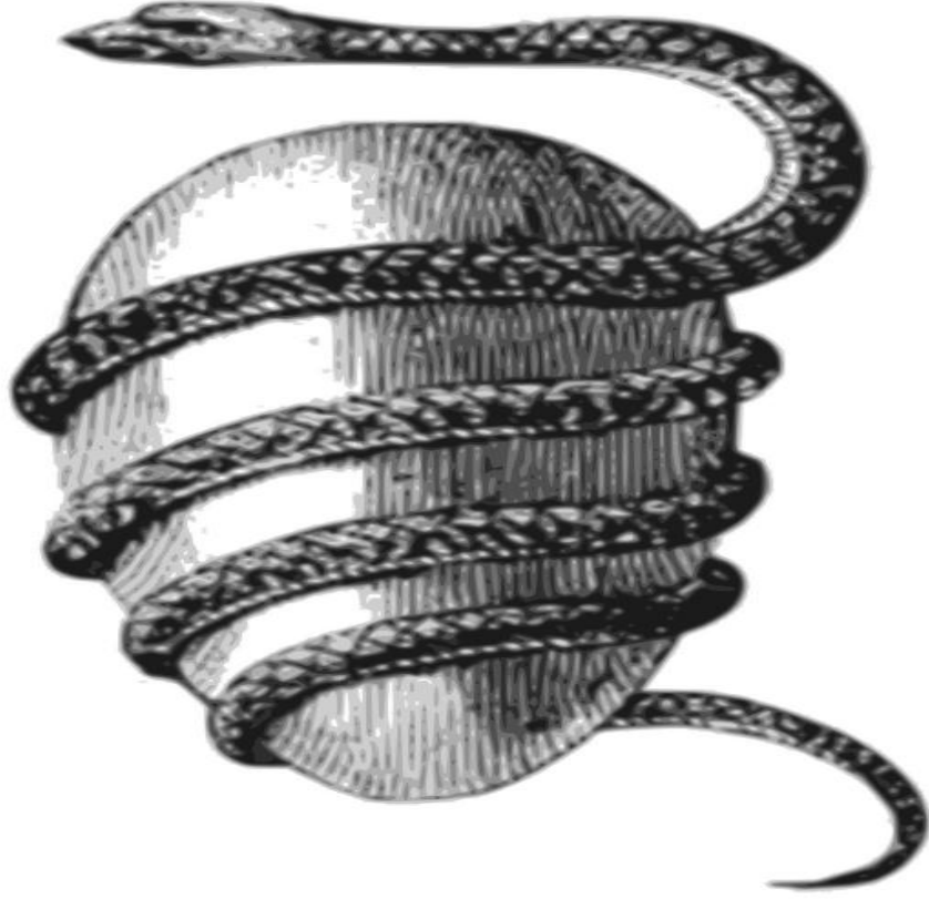
Şekil 9: Ophion Yılanı Tasviri (bkz. http://www.greekmythology.com/images/mythology/ophion_153.jpg , Erişim Tarihi, 20 Mayıs 2016).