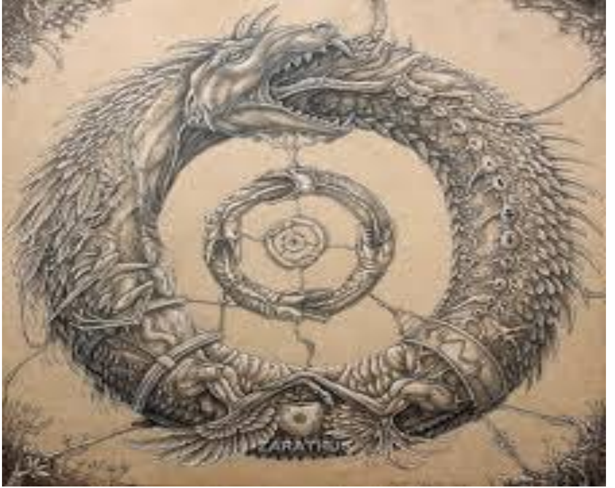
Şekil 12: Uroboros Tasviri

(bkz. http://i299.photobucket.com/albums/mm317/vickiemccolley/Ouroboros_by_zarathus.jpg , Erişim Tarihi, 25 Mayıs 2016).