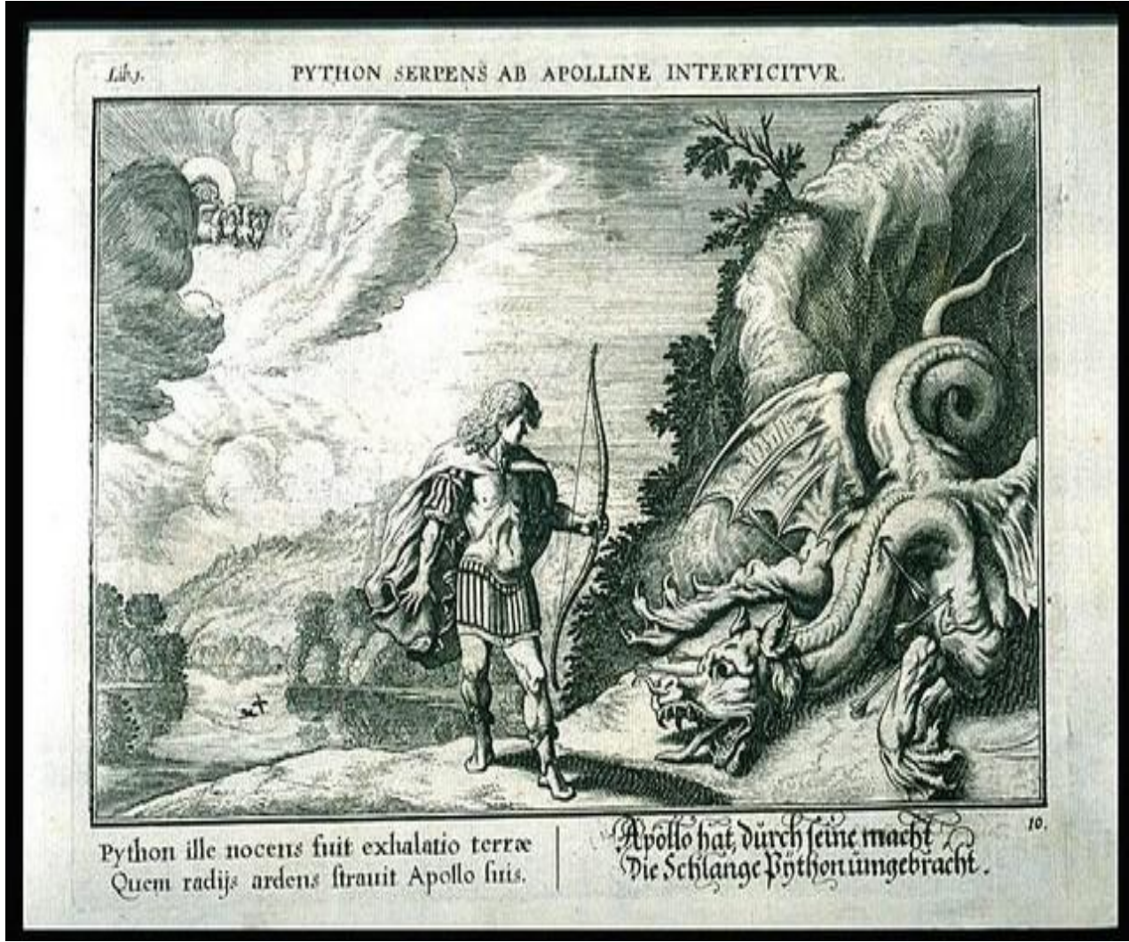
Şekil 11: Apollo ve Python

(bkz. http://cdn.list25.com/wp-content/uploads/2013/04/25-python_tn1.jpg , Erişim Tarihi, 25 Mayıs 2016)