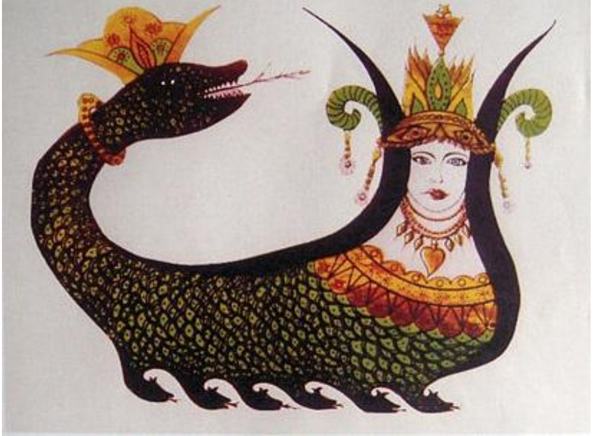
Şekil 4: Şahmeran Tasviri

(bkz. https://upload.wikimedia.org/wikipedia/commons/d/d9/%C5%9Eahmaran.jpg , Erişim Tarihi, 25 Mayıs 2016).