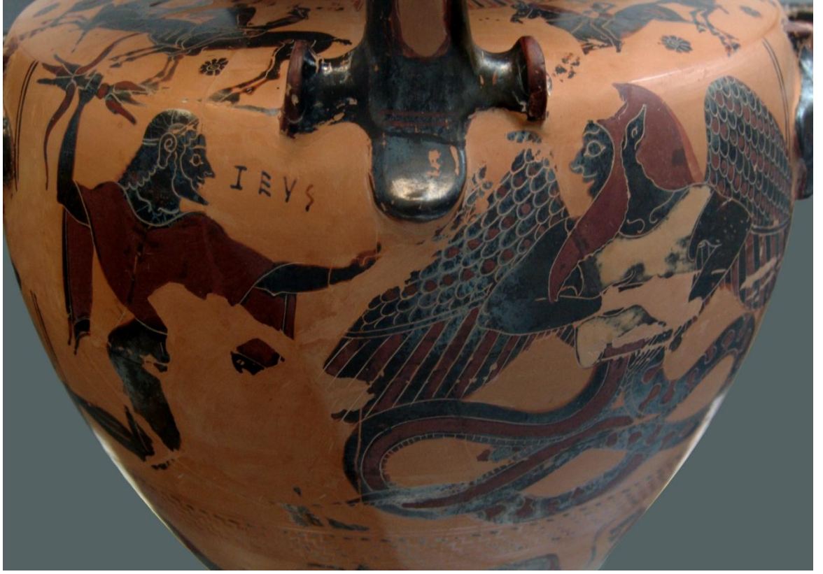
Şekil 10: Typhon ile Zeus'un Savaşının Tasviri

(bkz. https://upload.wikimedia.org/wikipedia/commons/d/d9/Zeus_Typhon_Staatliche_Antikensammlungen_596.jpg , Erişim Tarihi, 25 Mayıs 2016).