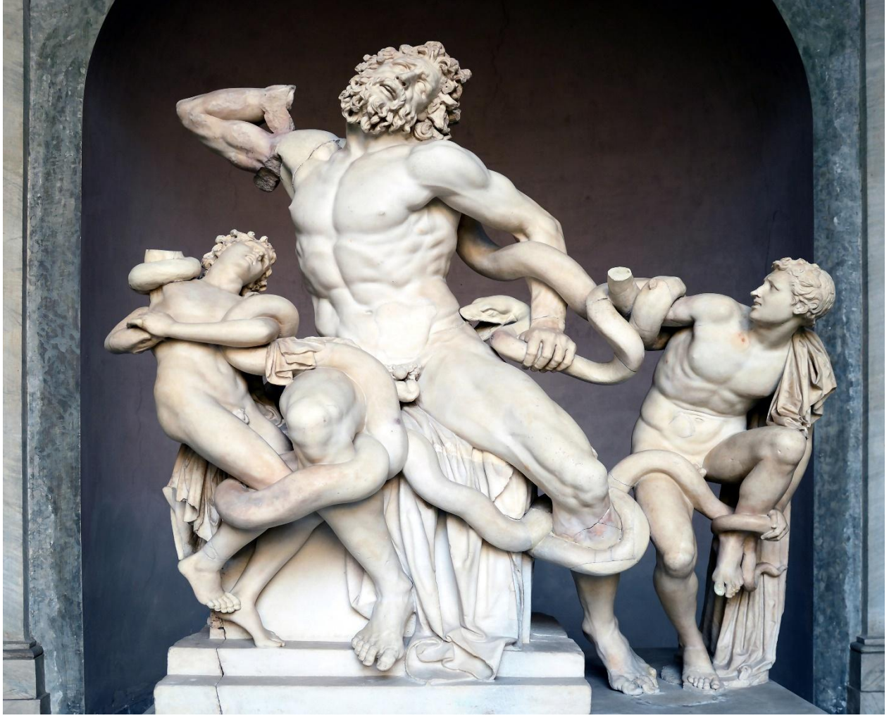
Şekil 13 Laokoon ve Oğulları

(bkz. https://upload.wikimedia.org/wikipedia/commons/b/bd/Laocoon_and_His_Sons.jpg , Erişim Tarihi, 20 Mayıs 2016).