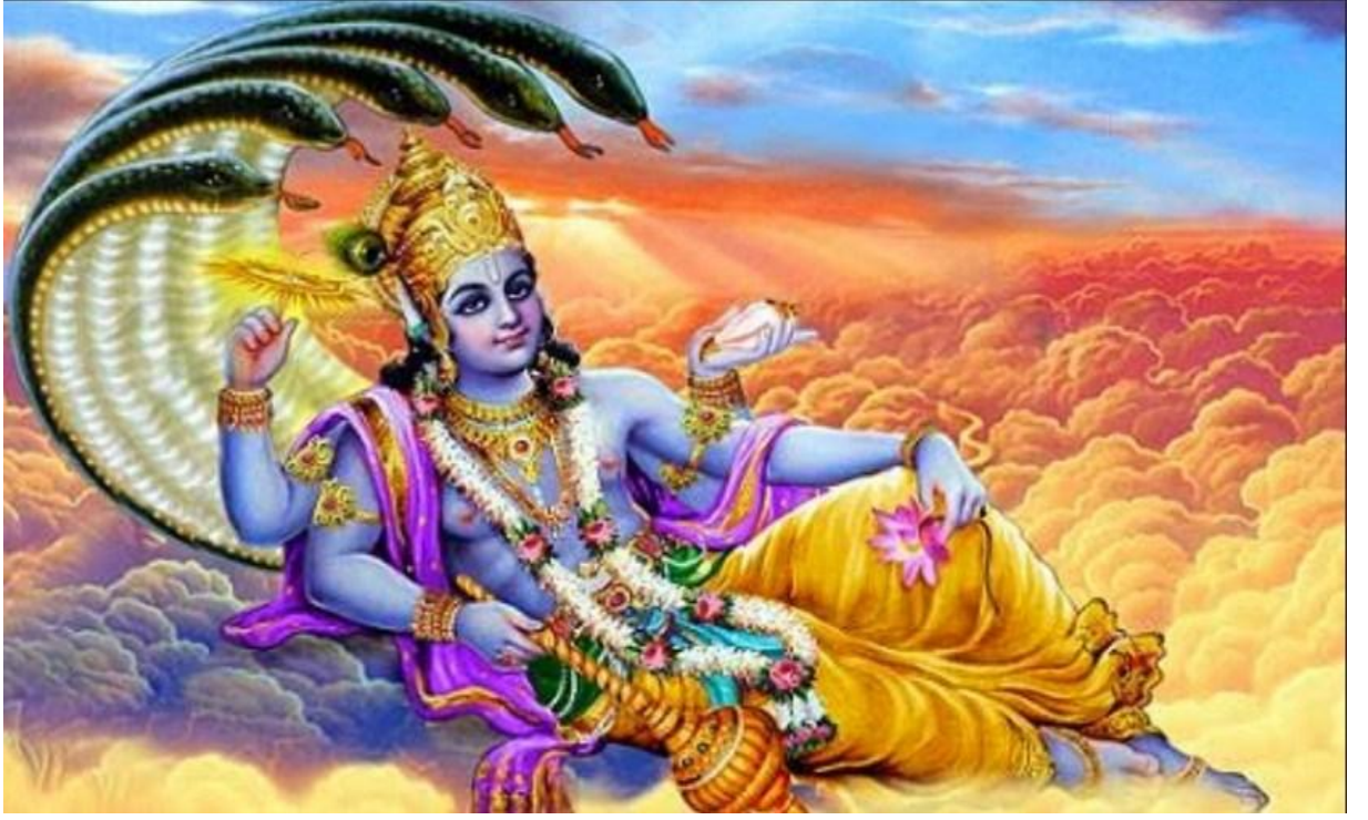
Şekil 7: Vişnu ve Beş Başlı Yılan Tasviri (bkz. http://blog.onlineprasad.com/wp-content/uploads/2015/04/Screenshot_1.jpg , Erişim Tarihi, 25 Mayıs 2016).