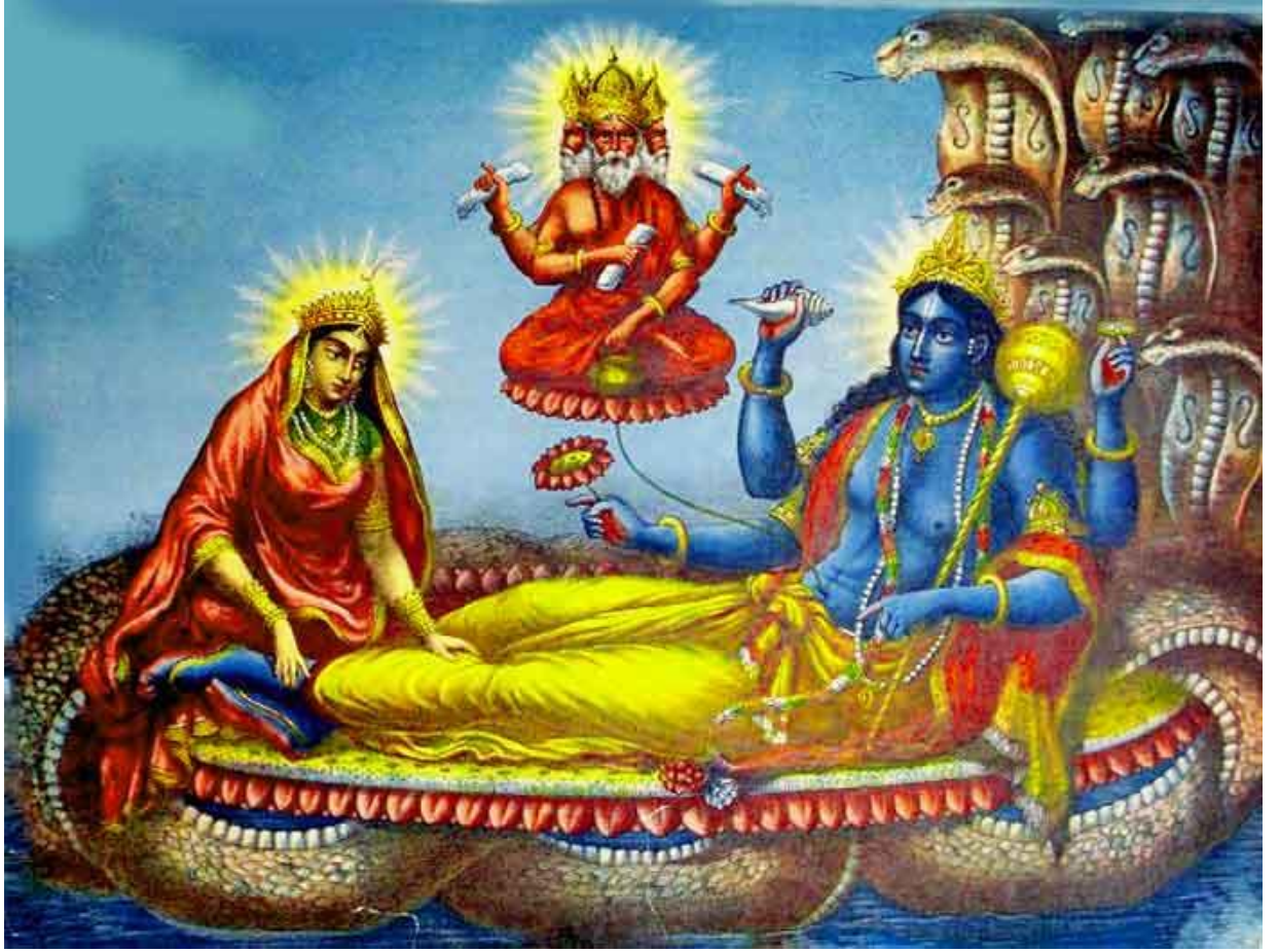
Şekil 8: Ananta ve Yedi Başlı Kobra Tasviri

(bkz. http://www.hinduwebsite.com/buzz/images/ananta-01.jpg , Erişim Tarihi, 25 Mayıs 2016).