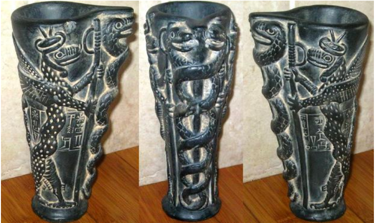
Şekil 3: Ningišzida Yılanı (bkz.

(bkz. https://dragondreaming.files.wordpress.com/2011/11/tiamat.jpg , Erişim Tarihi, 25 Mayıs 2016).