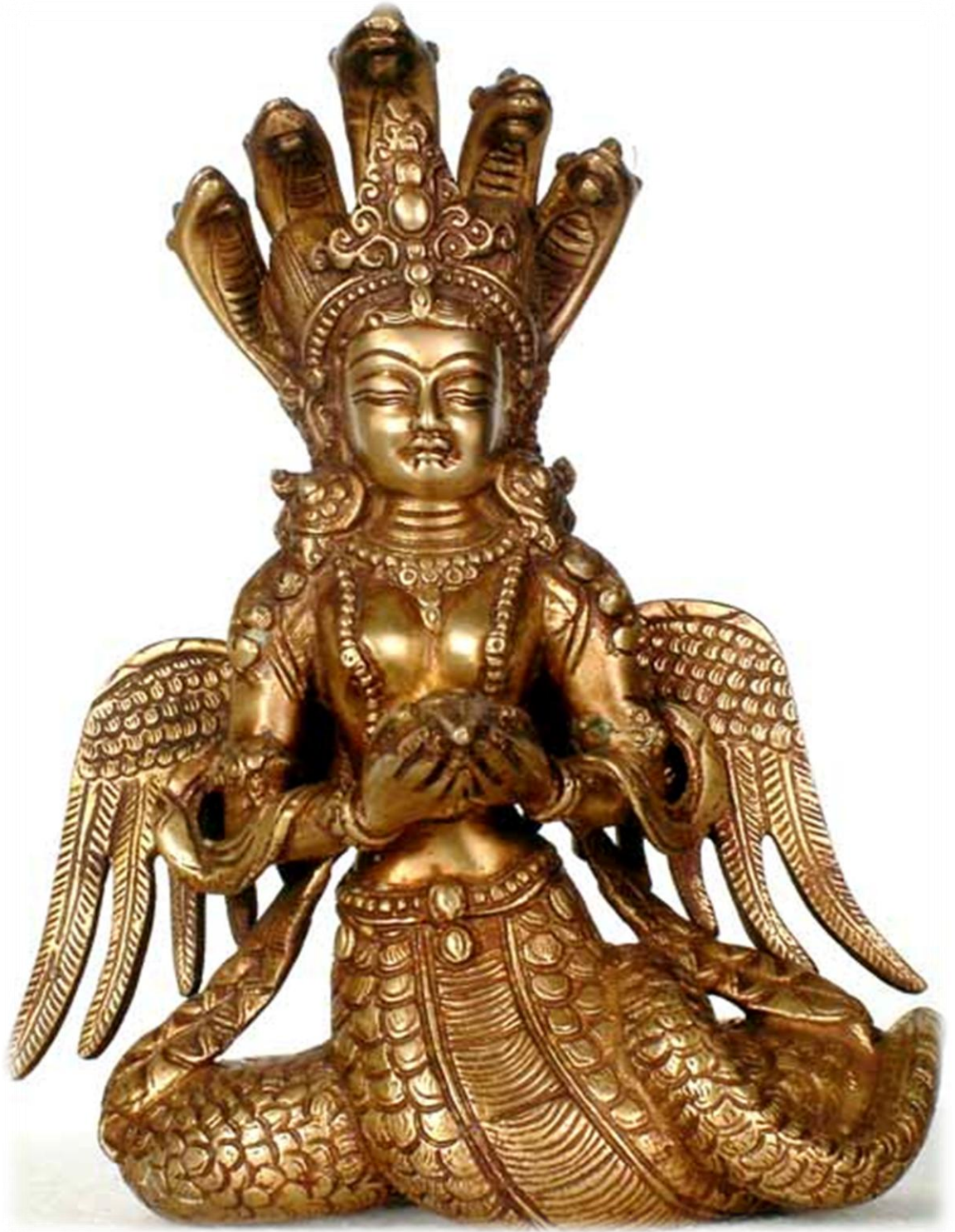
Şekil 6: Naga Yılanı Heykelciği (bkz. http://roberthood.net/blog/wp-content/uploads/2009/04/naga_kanya_the_snake_woman_zf52.jpg , Erişim Tarihi, 20 Mayıs 2016).