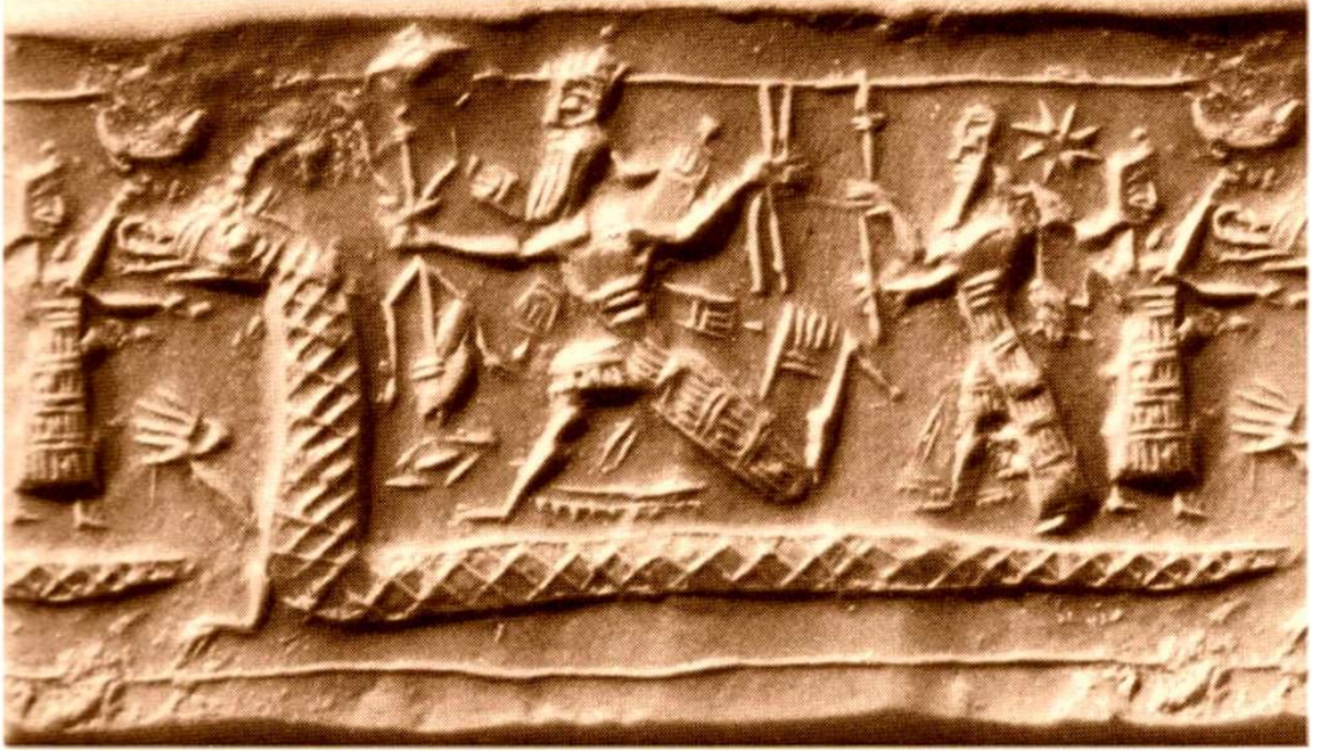
Şekil 2: Enuma Eliş Miti Yılan Tasviri

(bkz. https://dragondreaming.files.wordpress.com/2011/11/tiamat.jpg , Erişim Tarihi, 25 Mayıs 2016).