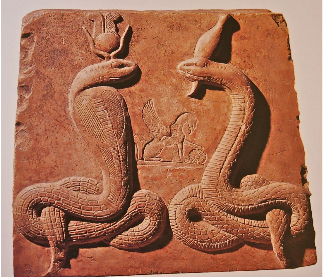
Şekil 5: İsis Yılanları Kabartması

(bkz. https://isiopolis.files.wordpress.com/2013/03/agathetycheagathosdaimon.jpg , Erişim Tarihi, 20 Mayıs 2016)