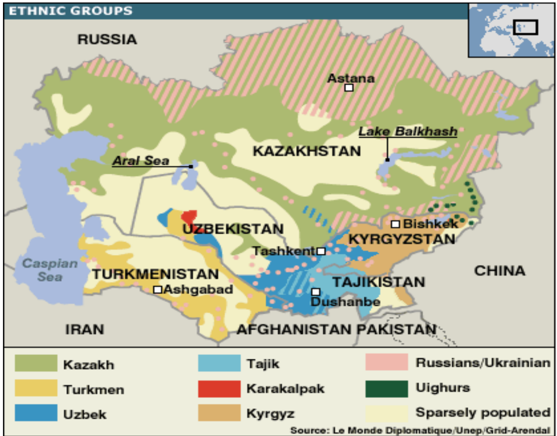
Şekil 1: Orta Asya’da Etnik Gruplar.

Örneğin, Özbekler bölgenin en çok nüfusa sahip ve Orta Asya ülkelerinin demografik yapısında ciddi oranda üstün durumdadır. Özbekler, Tacikistan nüfusunun