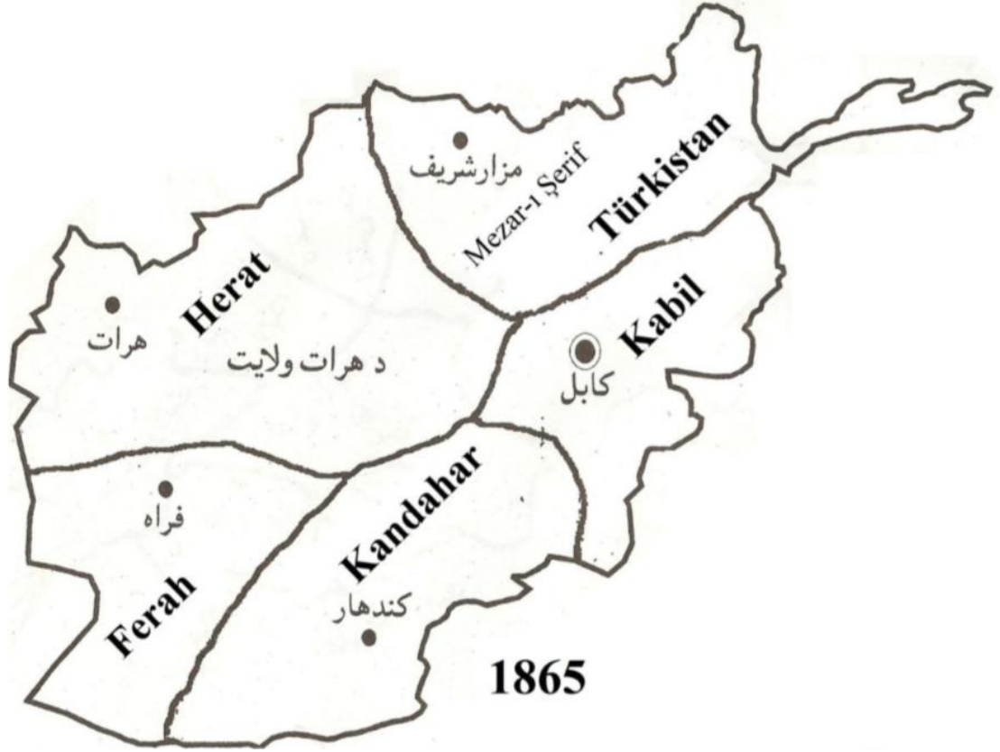
Afganistan'ın 1865 yılında Mülki Taksimat Haritası.