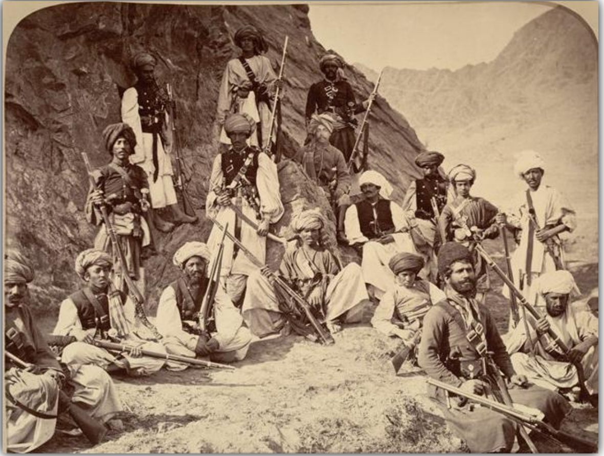
Ek 3: II. İngiliz-Afgan Savaşı. 277