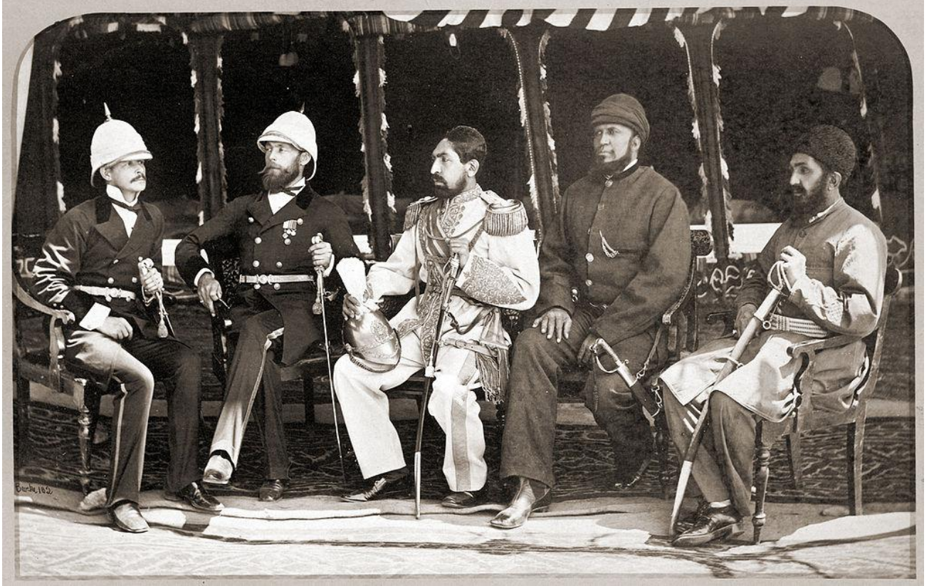
Afganistan Şah'ı Emir Muhammed Yakup Han