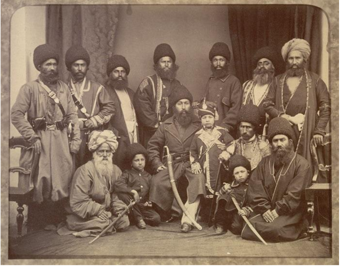
(1868-1879) Afganistan Şah'ı Emir Şir Ali Han